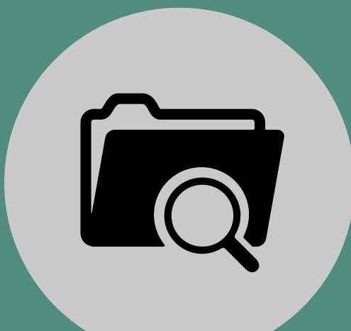
Icono carpeta (arriba-izquierda)