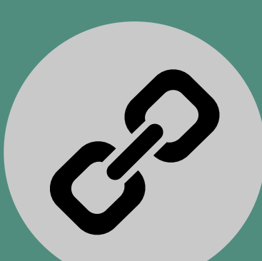
Haz clic en el icono de enlace