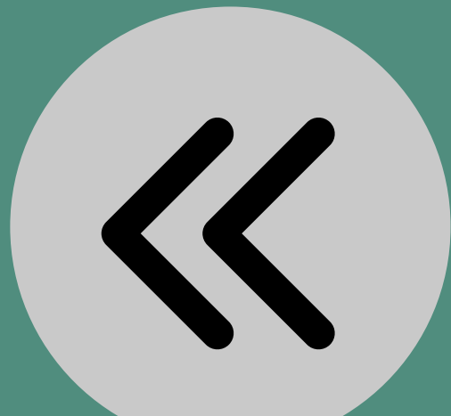
Regresa a la lista de archivos