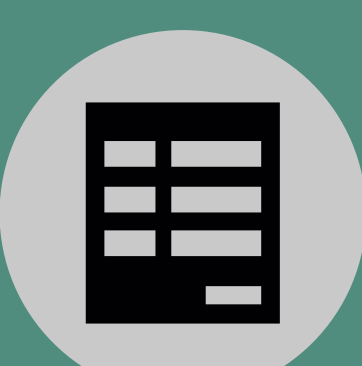
Rellena el siguiente formulario