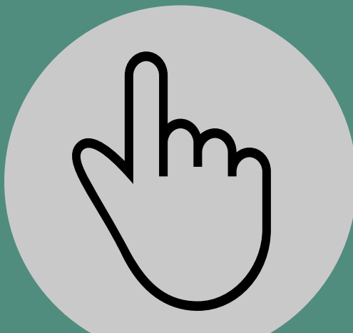
Selecciona la imagen

*Recuerda que además de subir imágenes propias, también puedes usar imágenes libres con pixabay.