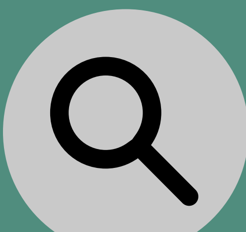
Arrastra las fotos de tu ordenador a la ventana o haz clic y busca en tu ordenador