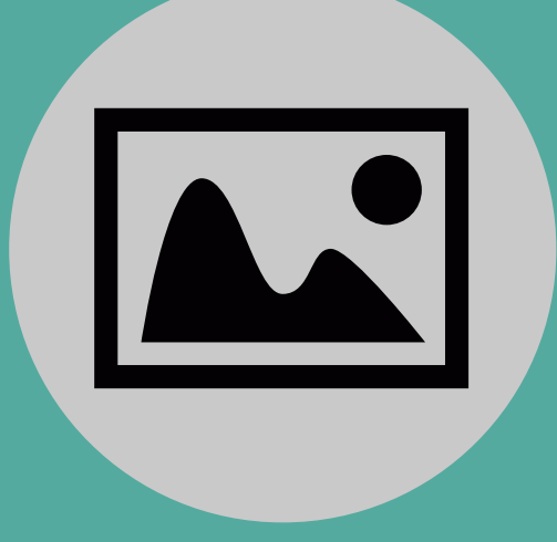
Imagen de portada en subpáginas.